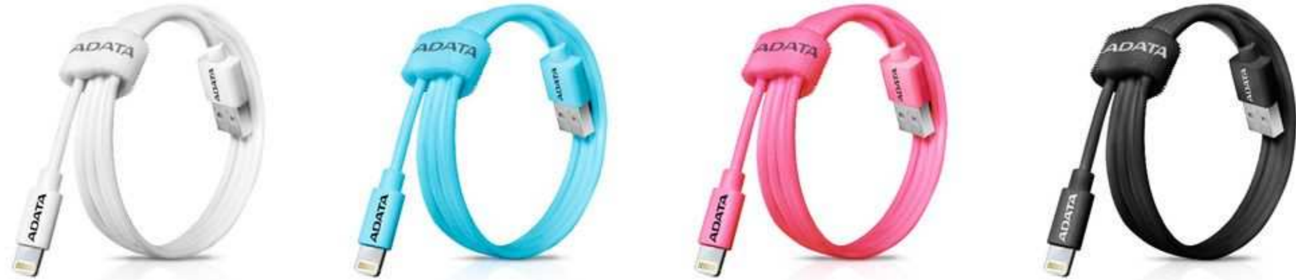
Variedad de colores , el cable se puede enrollar facilmente y llevarlo a donde quieras